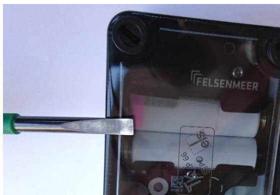
Abbildung 1: Öffnen des Gehäuses

Der BEACON ECO darf nur durch geschultes Personal in Betrieb genommen werden. Beachten Sie die ESD Schutzmassnahmen.