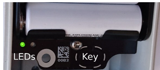
Abbildung 3: Bedienelemente

In dieser Phase kann man auch mit der Einstellung der Sendeleistung experimentieren. Der BEACON ECO sendet auf acht verschiedenen Sendeleistungstufen, die mit Hilfe der kapazitiven Taste (siehe Abbildung 3) eingestellt werden können.