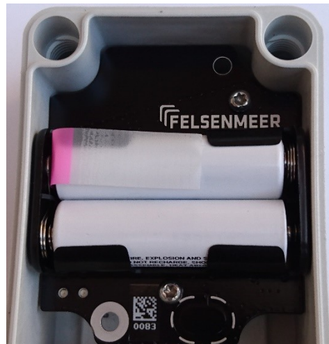
Abbildung 2: Offen, mit Isolationsband

Um andere Geräte nicht zu stören, erkennt der BEACON ECO ob der Kanal frei oder belegt ist. Wenn der Kanal belegt ist, versucht er später noch einmal zu senden. Dadurch kann es vorkommen, dass die grüne LED zunächst nicht im vier Sekunden Takt blinkt. Nach ein paar Minuten sollte sich jedoch ein stabiler vier Sekunden Takt einstellen. Wenn nicht, ist vermutlich ein Störsender aktiv. In diesem Fall muss mit Hilfe eines Notrufgeräts bzw. eines Service-Sticks gesondert geprüft werden, ob die BEACON ECOs trotz des Störsenders korrekt empfangen werden.